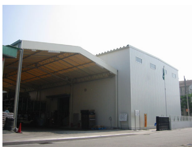
ラック倉庫・荷捌き場テント上屋

弊社は、総合建設コンサルタントとして、今後ともお客様のあらゆるニーズにお応えいたします。