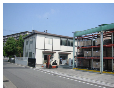
物流事務所・手動ラック