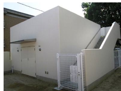
津波対策の避難倉庫

弊社は今後共、進行する少子高齢化社会のお役に立つ施設の設計・監理業務に取り組んでまいります。