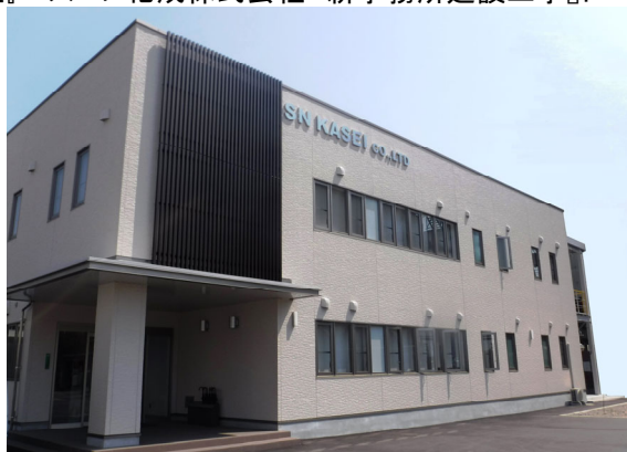
【正面入口（北側）からの外観】

設備面では、LED等の環境配慮型照明や窓からの日射による暑さ対策として、遮光フィルム等を採用するなど環境問題に配慮し、省エネルギー対策に積極的に取り組む企業姿勢を示したものになっております。