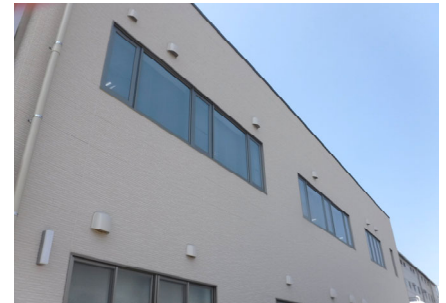
2階南面 遮光フィルム