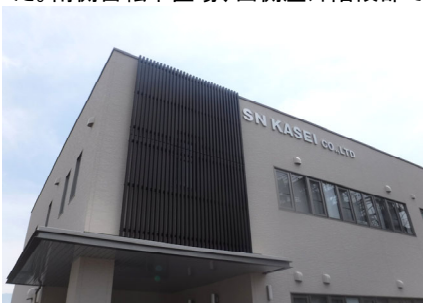
北側：化粧ルーバー

前面道路から事務所まで距離がある為、来客者からも視認しやすい化粧ルーバーを採用し、外観にアクセントを加えました。南側自転車置場、西側屋外階段部では、通路を幅広く活用しやすいよう利用者目線で設計しております。