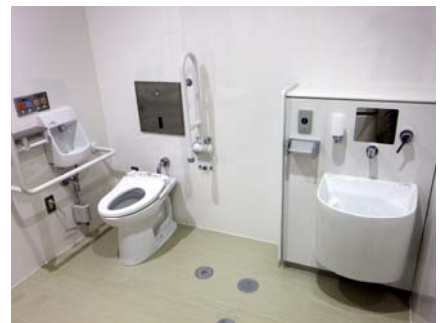
内部：多目的トイレ