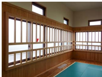
内部：柔剣道場窓廻り