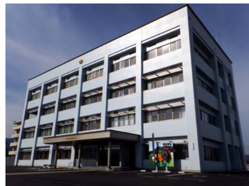
【幹線道路からの外観】

【庁舎施設概要】 建設場所：愛媛県西条市周布 構造規模：鉄筋コンクリート造4階建 延床面積：約 2,800 m 2 建築面積：約 800 m 2