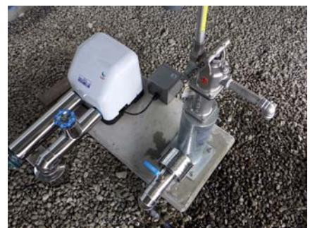
手押し井戸ポンプ