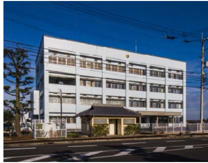
前面道路（南側）からの外観