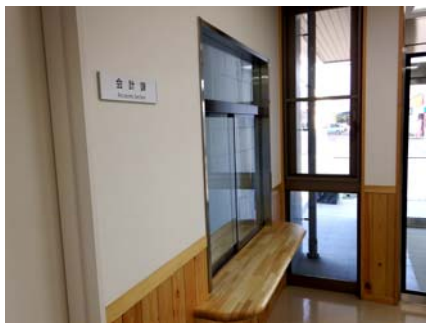
内部：玄関廻りカウンター（板張り）