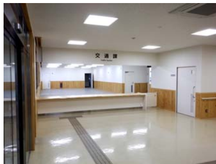
内部：ホール事務室（腰壁板張り）