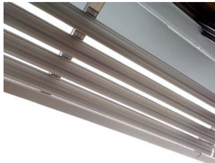
アルミ製ルーバー（日射対策）