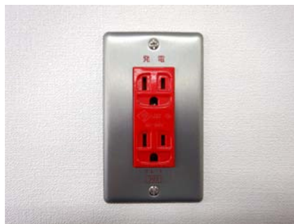
非常用コンセント