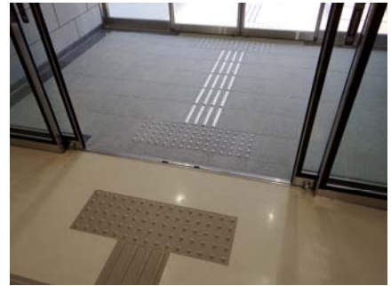
内部：出入口（点字ブロック）