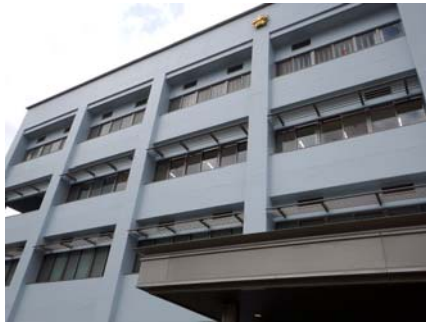
南側外観（窓上部アルミ製ルーバー）