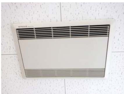
全熱交換機（熱損失の低減）